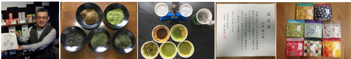
←お好み茶葉 20g 進呈！